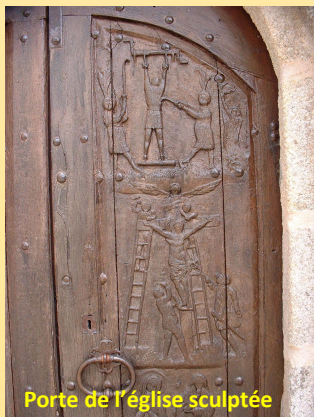
Porte de l'église sculptée

① – Dans un virage de la Bâtisse, prenons le chemin herbeux qui part en face entre deux maisons. Ce sentier décrit un demi-cercle autour du Bois de Tempétier (bien suivre le chemin principal sur cette